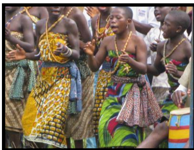
Aldeões de Dzogbégan