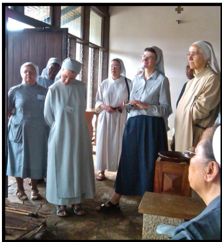
Torre da capela em Dzogbégan

A hospitalidade que reinava entre os diferentes países durante o período colonial permitiu aos Colonizadores subjugar os africanos. Em Ouidah, o arco do “Ponto do não Retorno” permanece como um sinal, mas a “Porta do Retorno” erigida em 2000, expressa a esperança de que a África Oeste não perca sua hospitalidade e continue demonstrando sua nobreza ao acolher a todos com os braços abertos. A experiência de nossa curta estadia é um exemplo de que as dores do passado foram superadas pelo amanhecer de uma nova esperança.