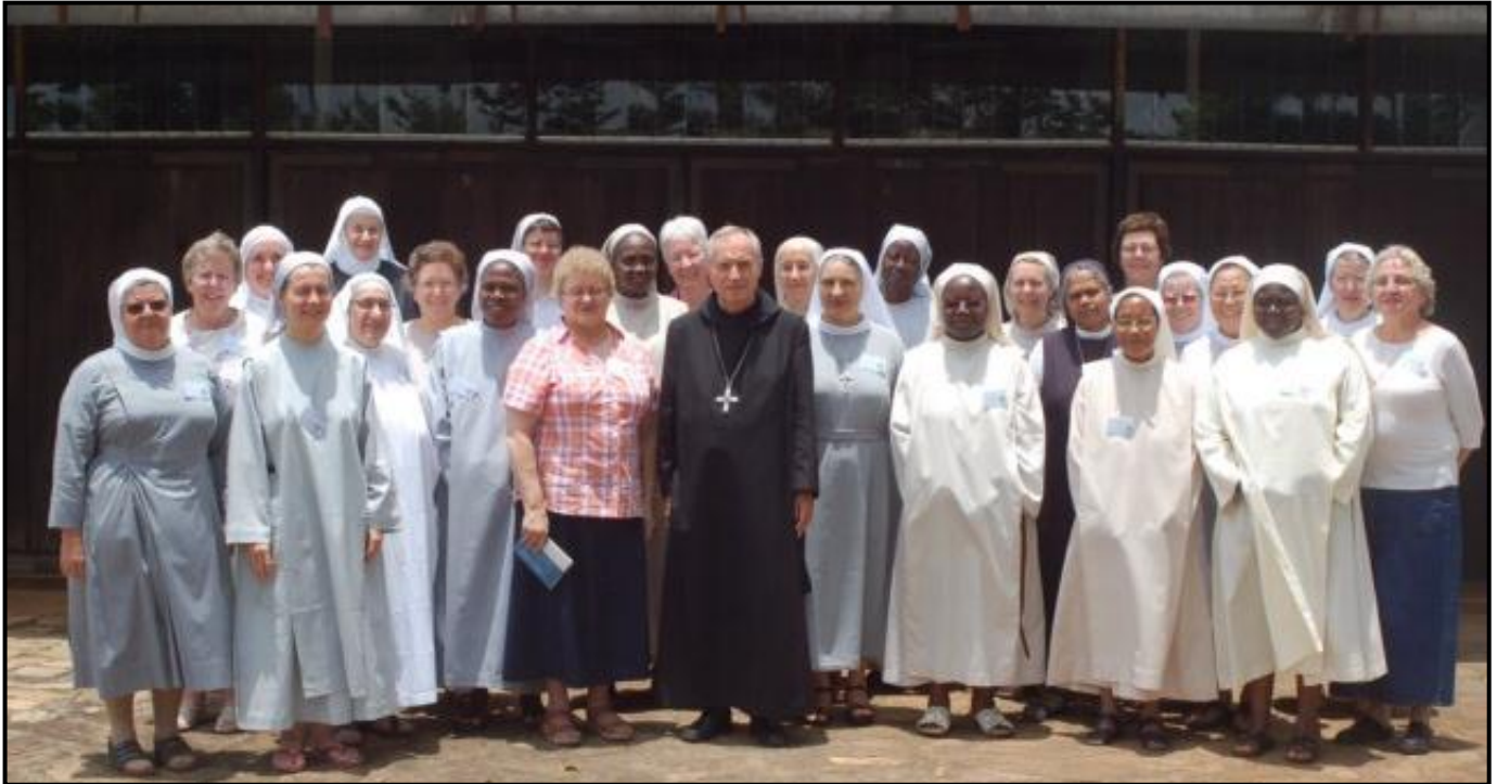
Conferência da CIB na África Oeste em 2011