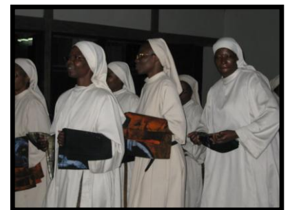
Apresentação da Bandeira