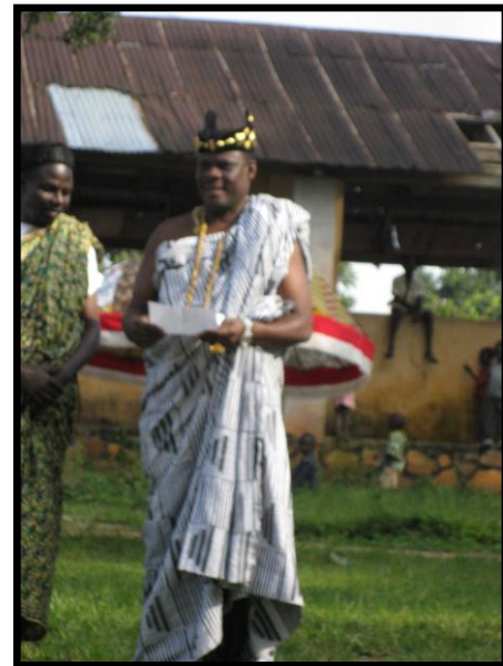
Chefe Atado e membros da Comunidade

inesquecível e afortunadamente bom. Estou completamente certo e convencido de que vocês ganharão sua recompensa no céu. Que o Deus Onipotente abençoe vocês e toda a aldeia. Sintam-se em casa.